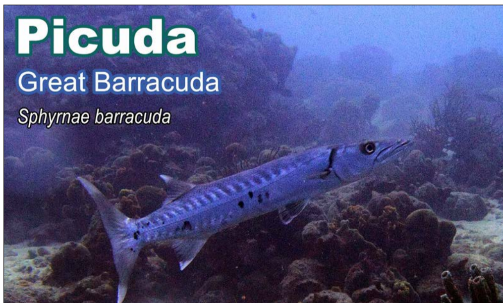
Picuda Great Barracuda Sphyraena barracuda

Di grandi pa chikito: Pecho Blanco, Picuda, Blekito, Banana, bleki